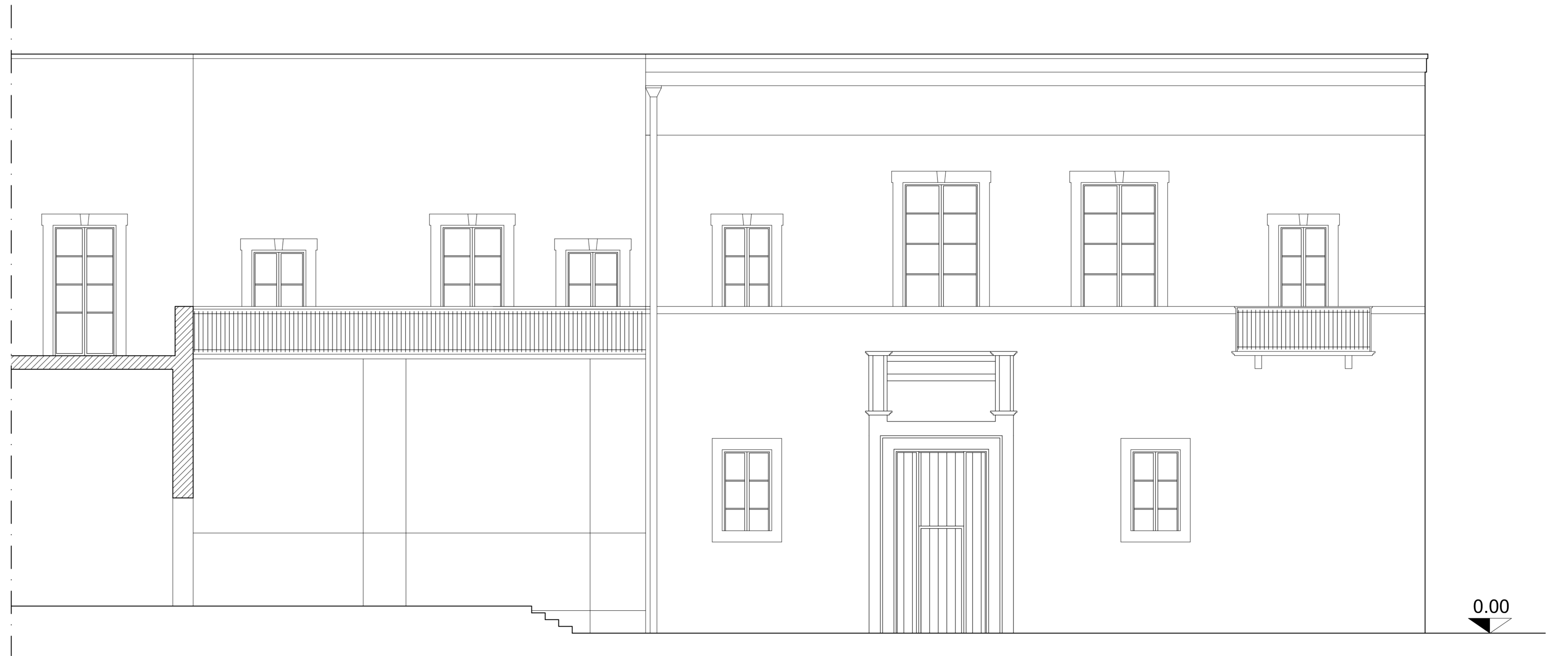
PROSPETTO SU PIAZZA S. AGOSTINO